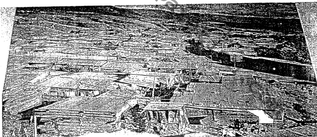
La crise urbaine dans les pays en développement : le bidonville de Mezquital, à 13 km du centre de la ville de Guatemala.

Document 2 : La crise urbaine dans les pays en développement : un bidonville au Guatemala